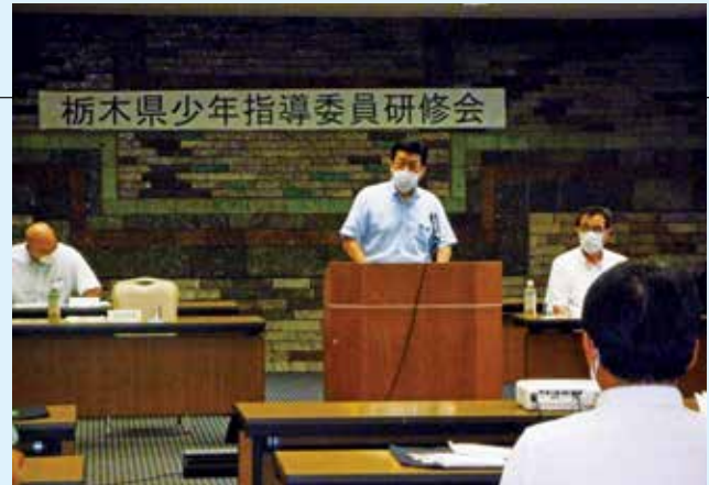
人身安全少年課長のあいさつ

栃木県警察本部生活安全部人身安全少年課と連携して研修会を開催し、当センター専務理事が、少年指導委員の方に対し「少年を暴力団から守るために」と題する講話を行いました。