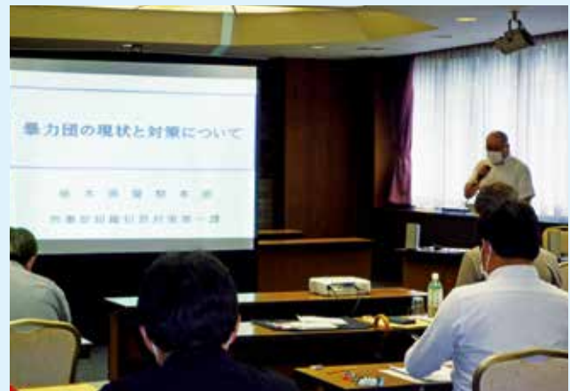
栃木県警察本部刑事部 組織犯罪対策第一課 課長補佐の講話